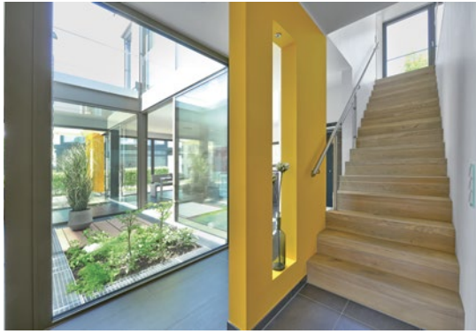
Das Atrium, ein verglaster nach oben hin offener Bereich in der Mitte des zweigeschossigen Hauses, sorgt für zusätzliches Tageslicht im Gebäude.