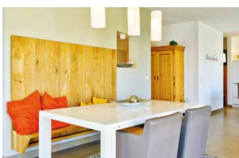
Von der Küche hat man den Weg zum Eingang im Blick. Nur die Speisekammer schirmt sie zur Diele hin ab.