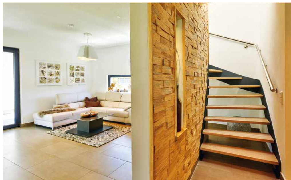
Im Erdgeschoss herrscht Offenheit: nur eine Wandscheibe mit Durchblick teilt den Wohnbereich zur Diele ab.

Ein Speisevergütung war gestern: Heute lässt sich der ganze von der hauseigenen Photovoltaik erzeugte grüne Strom selbst verbrauchen. Er wird im Sommer, wenn weit mehr produziert wird, als sich verbrauchen oder in der 10-kW-Hausbatterie einlagern lässt, in einem virtuellen Energiespeicher registriert. Und wenn's im Winter kalt und dunkel ist, wird die auf diese Art gespeicherte Strommenge kostenlos zurückgeliefert.