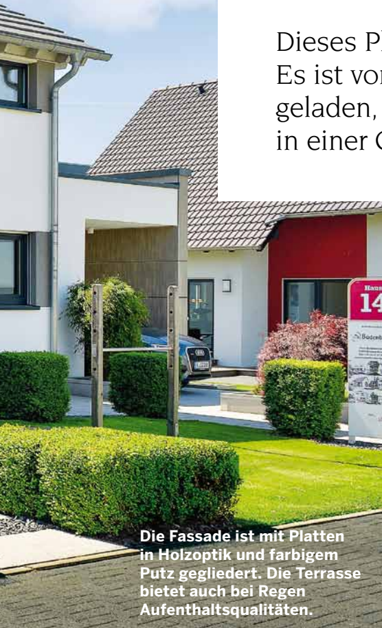
Die Fassade ist mit Platten in Holzoptik und farbigem Putz gegliedert. Die Terrasse bietet auch bei Regen Aufenthaltsqualitäten.

Dieses Plusenergiehaus ist nicht nur architektonisch modern. Es ist vor allem energietechnisch top: Ist seine Batterie geladen, wird der überschüssige selbst erzeugte Sonnenstrom in einer Cloud gespeichert und im Winter wieder abgerufen