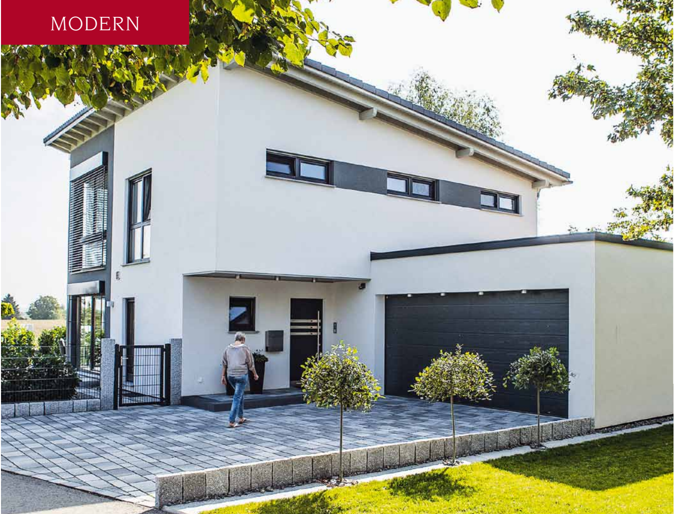
Zur Eingangsseite nach Norden eher zugeknöpft präsentiert sich das moderne Pultdachhaus.