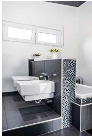
Zur modernen Architektur passt das Designerbad, das sich die Baumanns aussuchten.