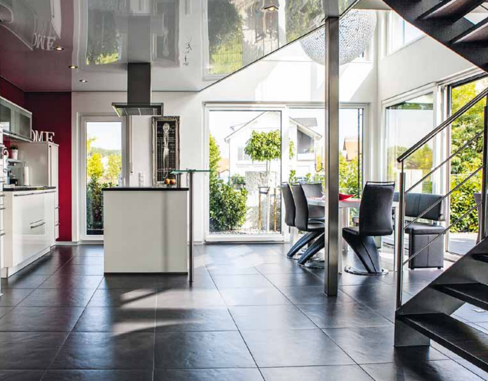
Die nach Südwesten ausgerichtete riesige Glasfront flutet den Wohn- und Essbereich mit Licht.

raldämmwolle, Holzwolle, trockenes, naturbelassenes Holz, Gips und Putz.