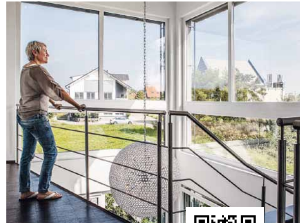
Von der Galerie schweift der Blick über Streuobstwiesen.